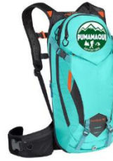
RECIPIENTE DE HIDRATACIÓN